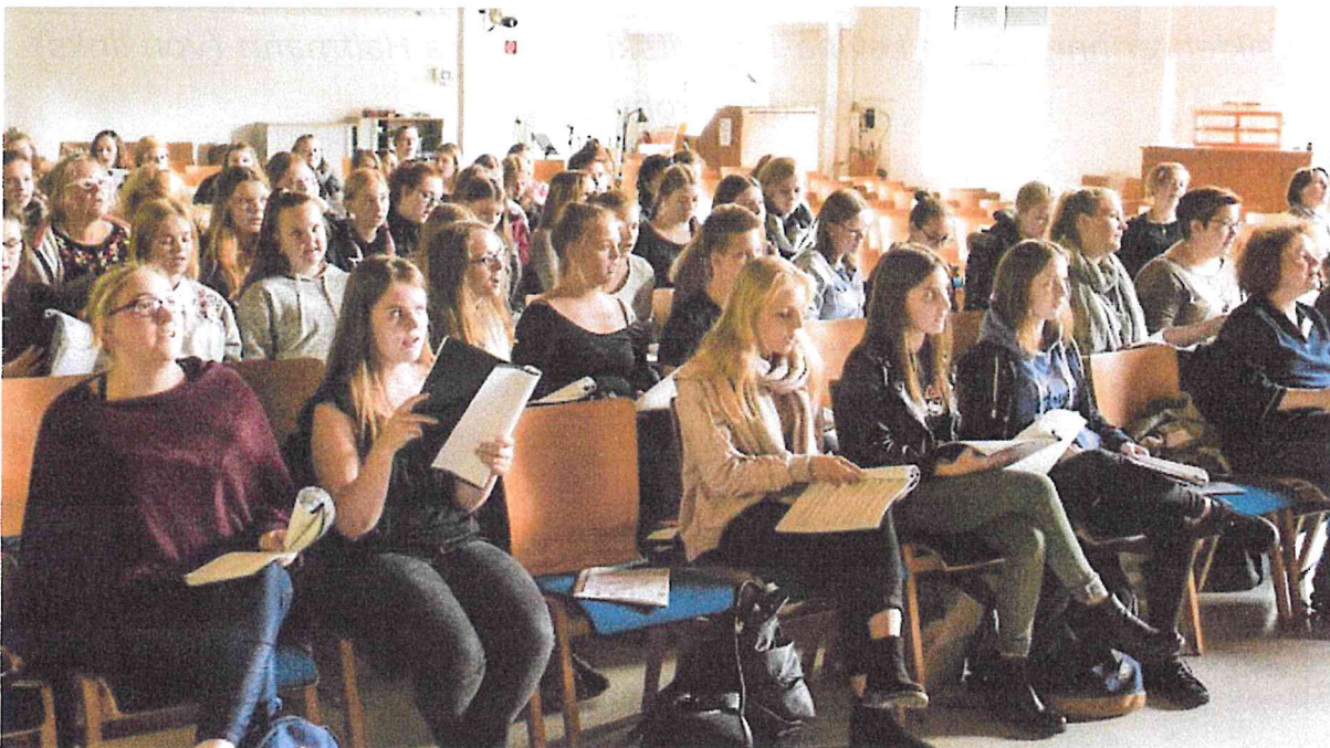
Die erste Chorprobe